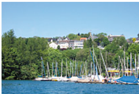
Bildungszentrum Sorpesee der VHS Hochsauerlandkreis

Teaching language: english & german, 50/50